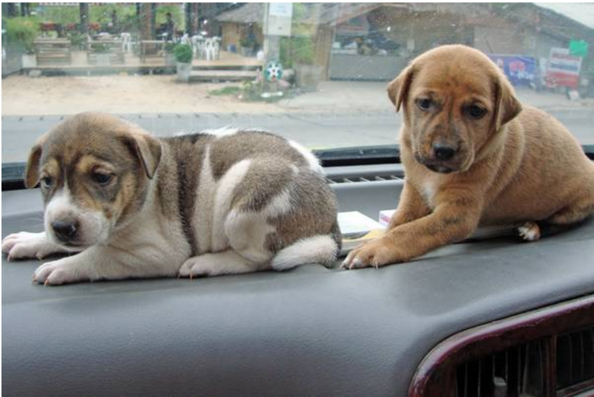
Im Welpenhaus bekamen sie dann einen schönen warmen Raum...