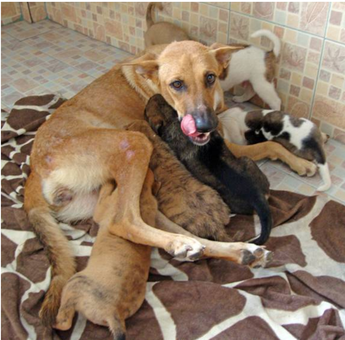
Die Mutter und eines der Babies hatten Bisswunden, die gleich bei Ankunft im Tierheim behandelt wurden.