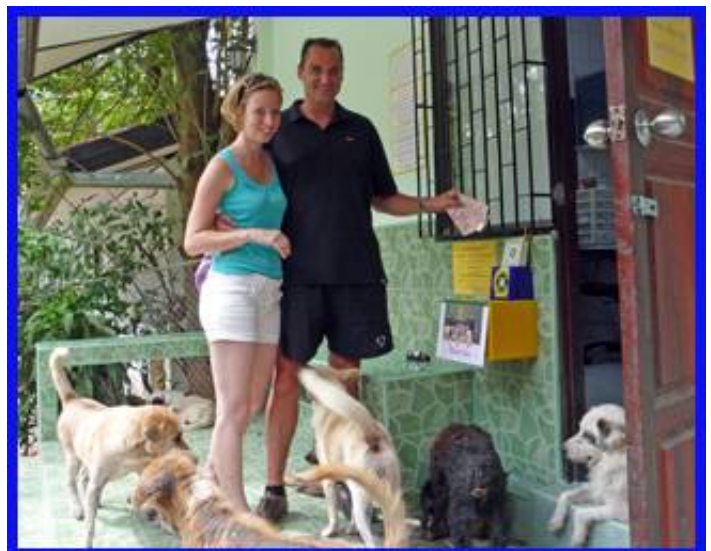
Die ersten Touristen haben unsere Spendenbox ge- funden. Es ist ein Safe, der innen an der Wand ver- schweißt ist. Ich denke viel mehr kann man nicht tun.