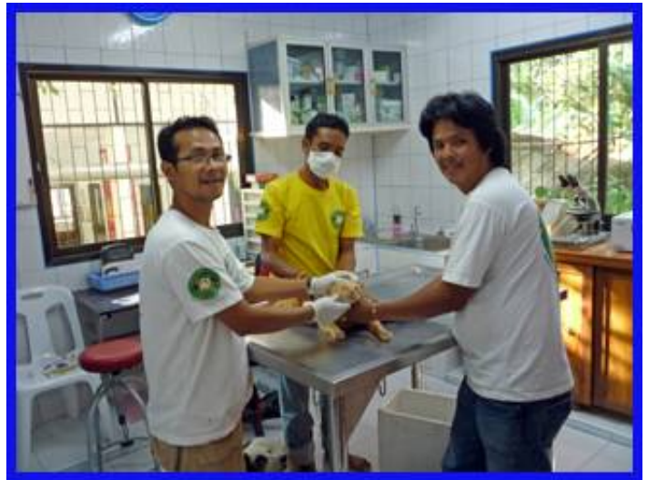
Behandlungsraum - 16 m 2 Dr. Sith, Bang und Ow