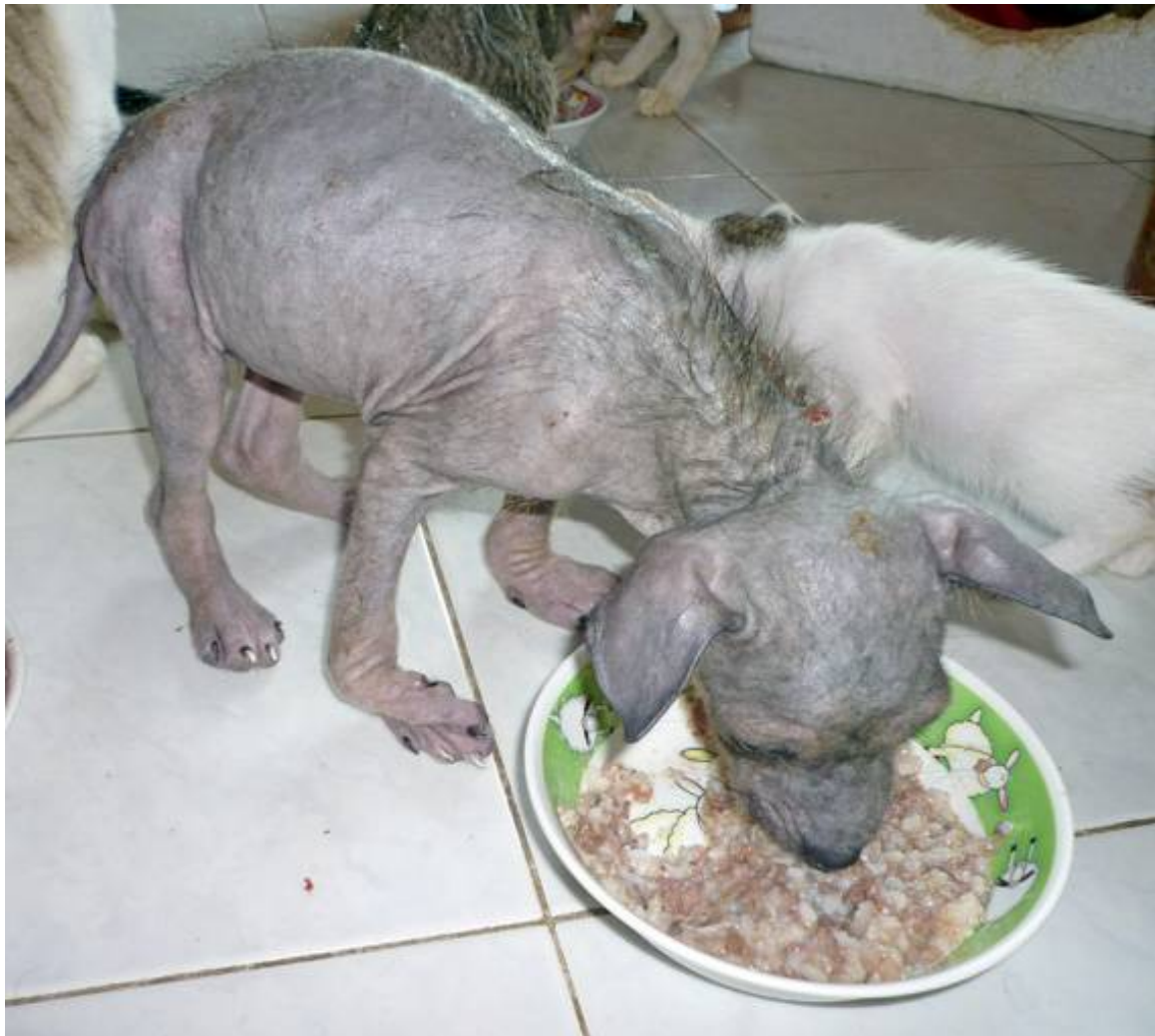
Leider knickt meine rechte Vorderpfote nach innen. Sie soll morgen fachgerecht bandagiert werden.