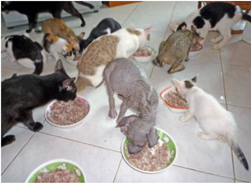
Das Essen schmeckt am Besten in Gesellschaft