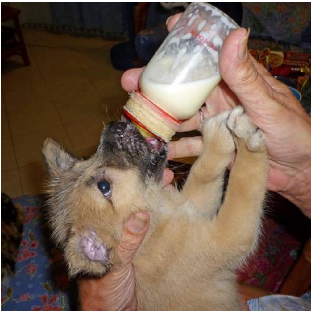
Meine Wahl viel auf MOPPELCHEN, der braucht allerdings zwischendurch immer noch seine Flasche...