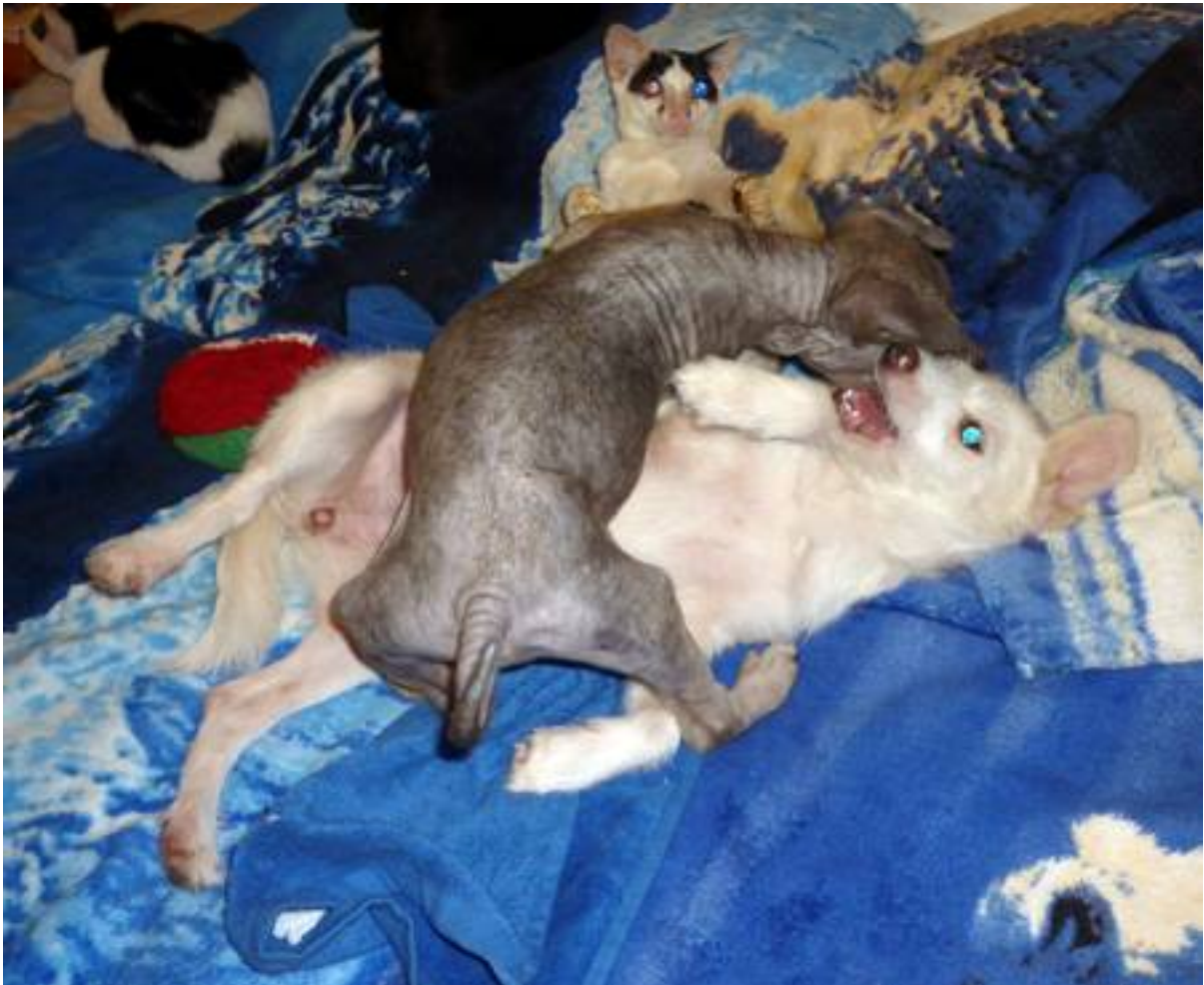
Nach dem Essen wird gespielt, natürlich mit Lilly.